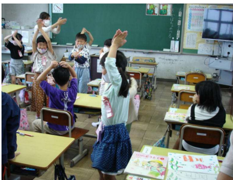
< 1年生：特別な教科道徳の学習 >