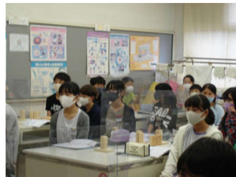
< 6年生：家庭科グループ学習 >