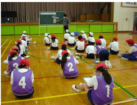
< 4年生：体育科振り返り学習 >