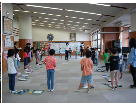
< 2年生：音楽科リズム打ち学習 >