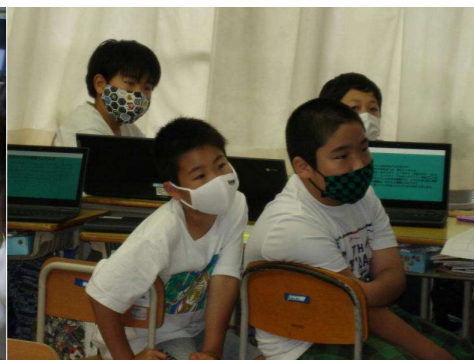
< 5年生：総合的な学習の時間 >