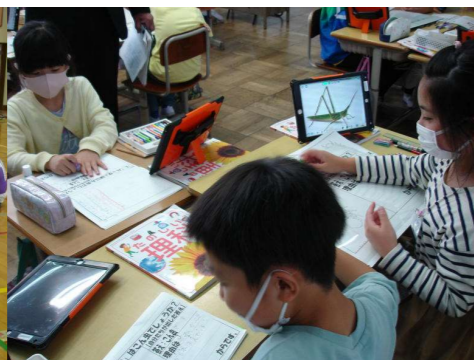
< 3年生：理科調べ学習 >