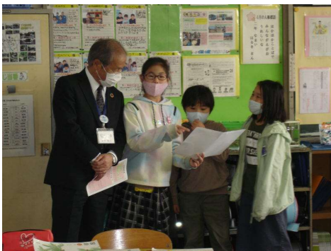
< 3年生：国語科「どきん」の発表練習 >