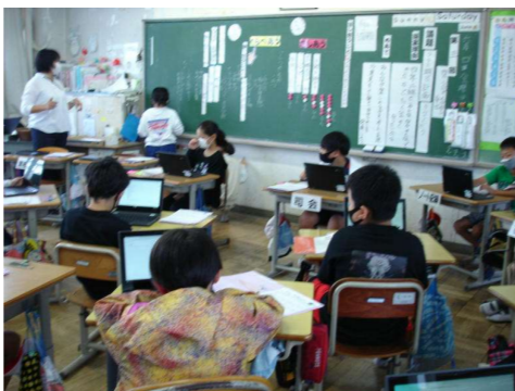
< 4年生：学級活動話し合い学習 >

6月1日と4日に、茨城県県西事務所と古河市教育委員会による学校訪問がありました。先生方が授業を参観し、児童の様子や学校の取組について指導してくださいました。教育用タブレットを活用した授業やグループでの話し合い活動など、児童が落ち着いて授業に臨んでいると好評でした。