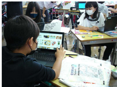
< 5年生：社会科調べ学習 >