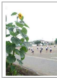
2mを超える大きさに育った向日葵

校舎の南側花壇に去年までの種がこぼれて芽が出た向日葵が大きく育っています。子供たちの様子を見守ってくれているようです。